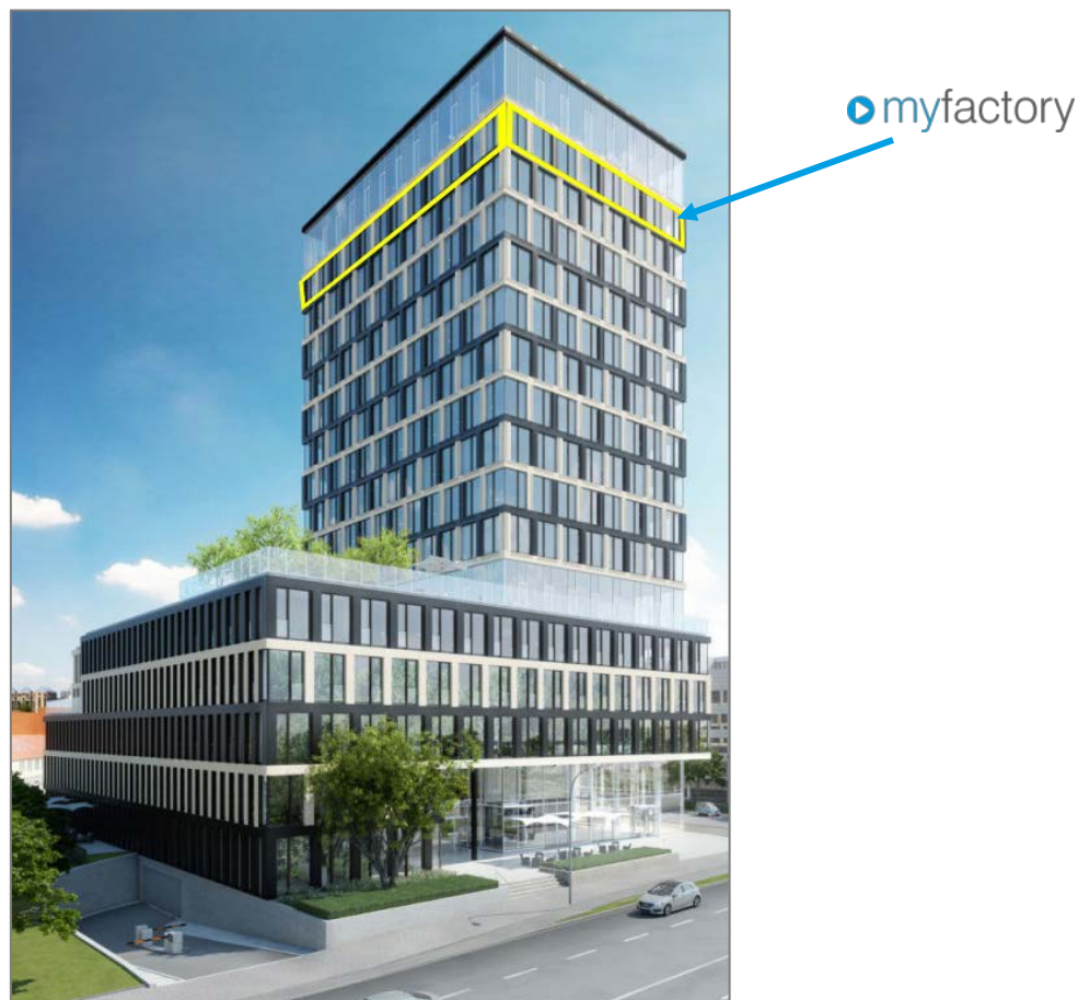
Abbildung: Highrise one

Die Büroräume, sowie unser Schulungsraum, befinden sich im 15. Stock des Gebäudes Highrise one.