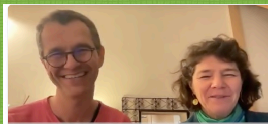
Partager son électricité avec ses voisins Retour d'Expérience après 6 mois - AMEP de Simiane

Le dernier lundi de chaque mois à 19h. Inscription gratuite sur